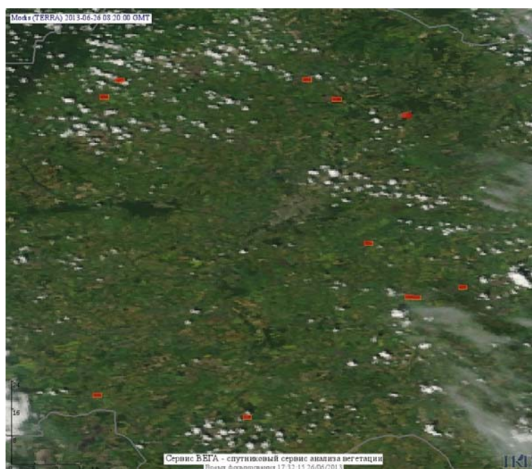
Рис. 3 Пожары в Орловской области

(Информация подготовлена на основе данных центров приема НИЦ "Планета" ( http://planet.iitp.ru/index1.html ), спутникового сервиса ВЕГА ( http://vega.smislab.ru/ ) и открытых зарубежных источников)