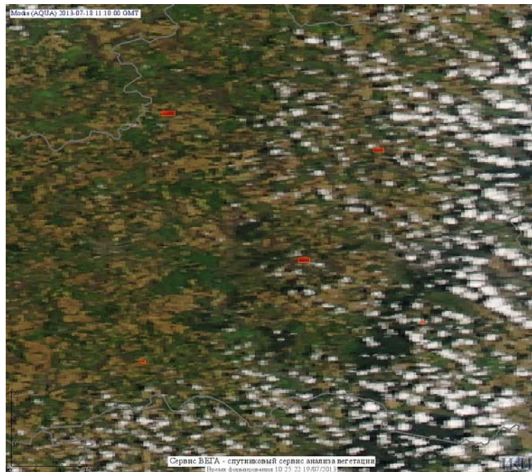
Рис. 3 Сельскохозяйственные палы в Липецкой области

(Информация подготовлена на основе данных центров приема НИЦ "Планета" ( http://planet.iitp.ru/index1.html ), спутникового сервиса ВЕГА ( http://vega.smislalab.ru/ ) и открытых зарубежных источников)