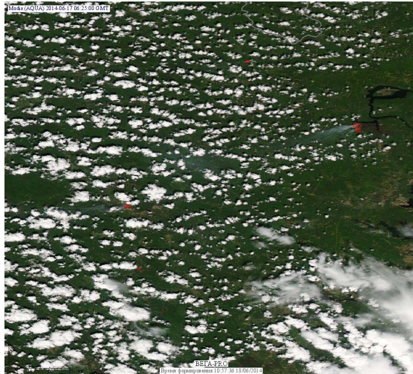
Рис. 2 Пожары в Иркутской области

(Информация подготовлена на основе данных центров приема НИЦ "Планета" ( http://planet.iitp.ru/index1.html ), спутникового сервиса ВЕГА ( http://pro-vega.ru ) и открытых зарубежных источников)