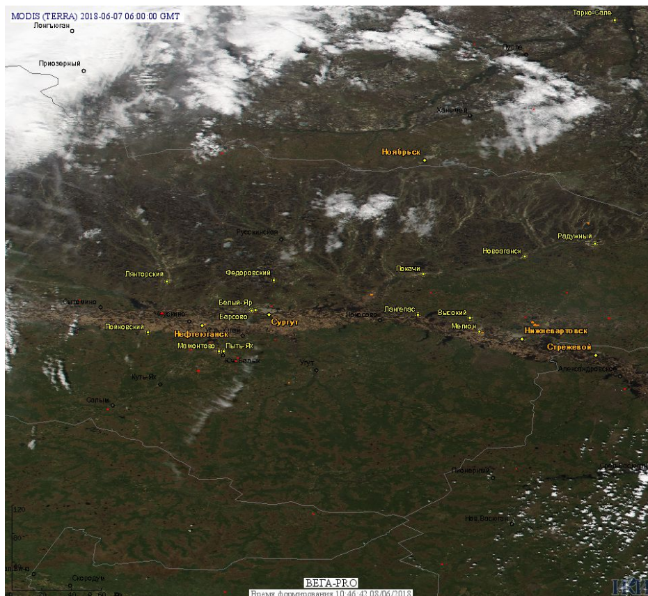
Рис. 3 Пожары в Ханты-Мансийском а.о. – Югре.

(Информация подготовлена на основе данных центров приема НИЦ "Планета" ( http://planet.iitp.ru/index1.html ), спутникового сервиса ВЕГА ( http://pro-vega.ru ) и открытых зарубежных источников)