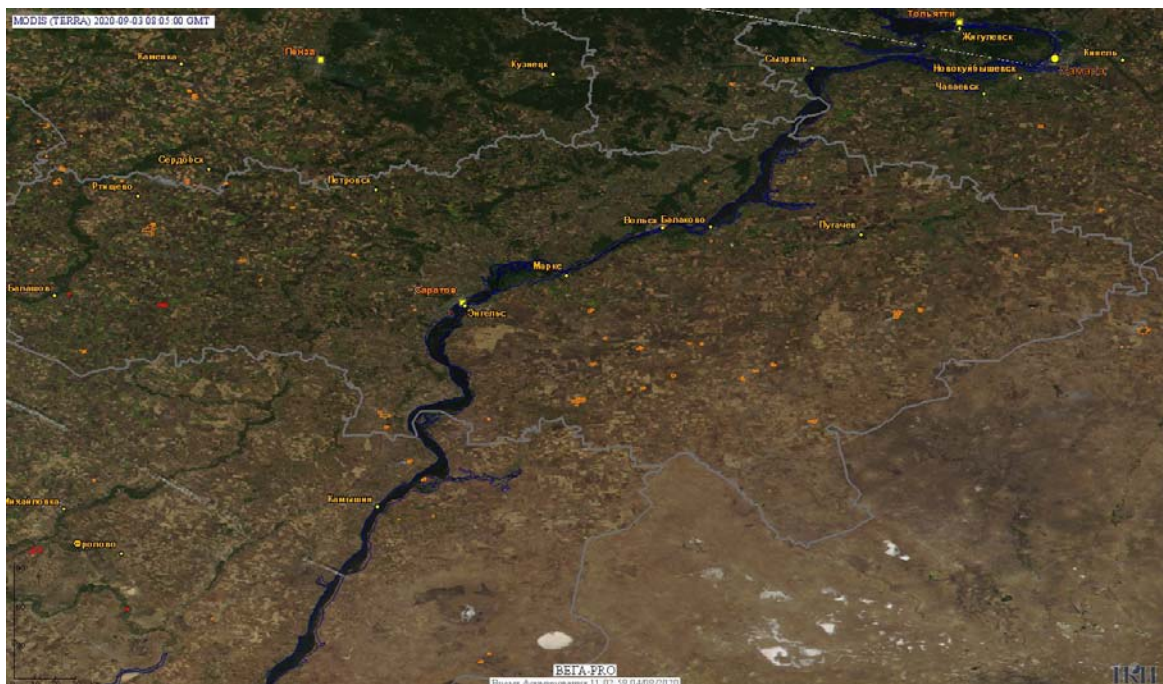
Рис. 1 Пожары и сельскохозяйственные палы в Саратовской области

Огнем было затронуто около 4,3 тыс га территории, покрытой лесом.