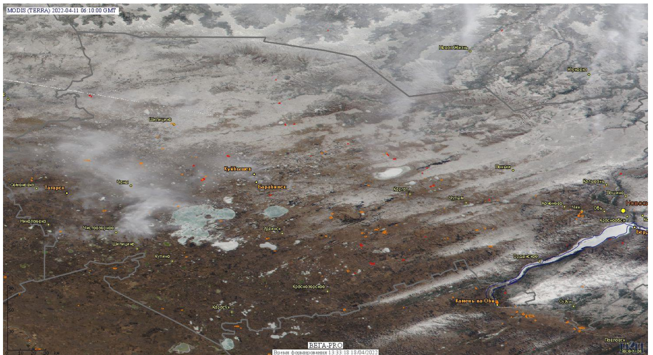
Рис. 1 Пожары и сельскохозяйственные палы в Новосибирской области

Огнем было затронуто около 10,3 тыс га территории, покрытой лесом.