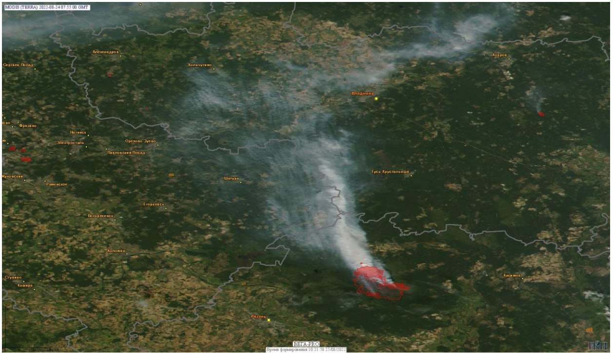
Рис. 2 Крупный пожар в Рязанской области