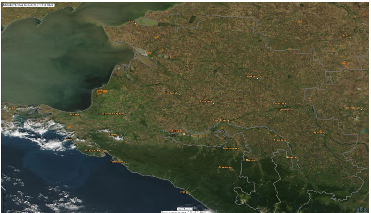
Рис. 1 Пожары и сельскохозяйственные палы в Краснодарском крае

Огнем было затронуто около 30,8 тыс га территории, покрытой лесом.