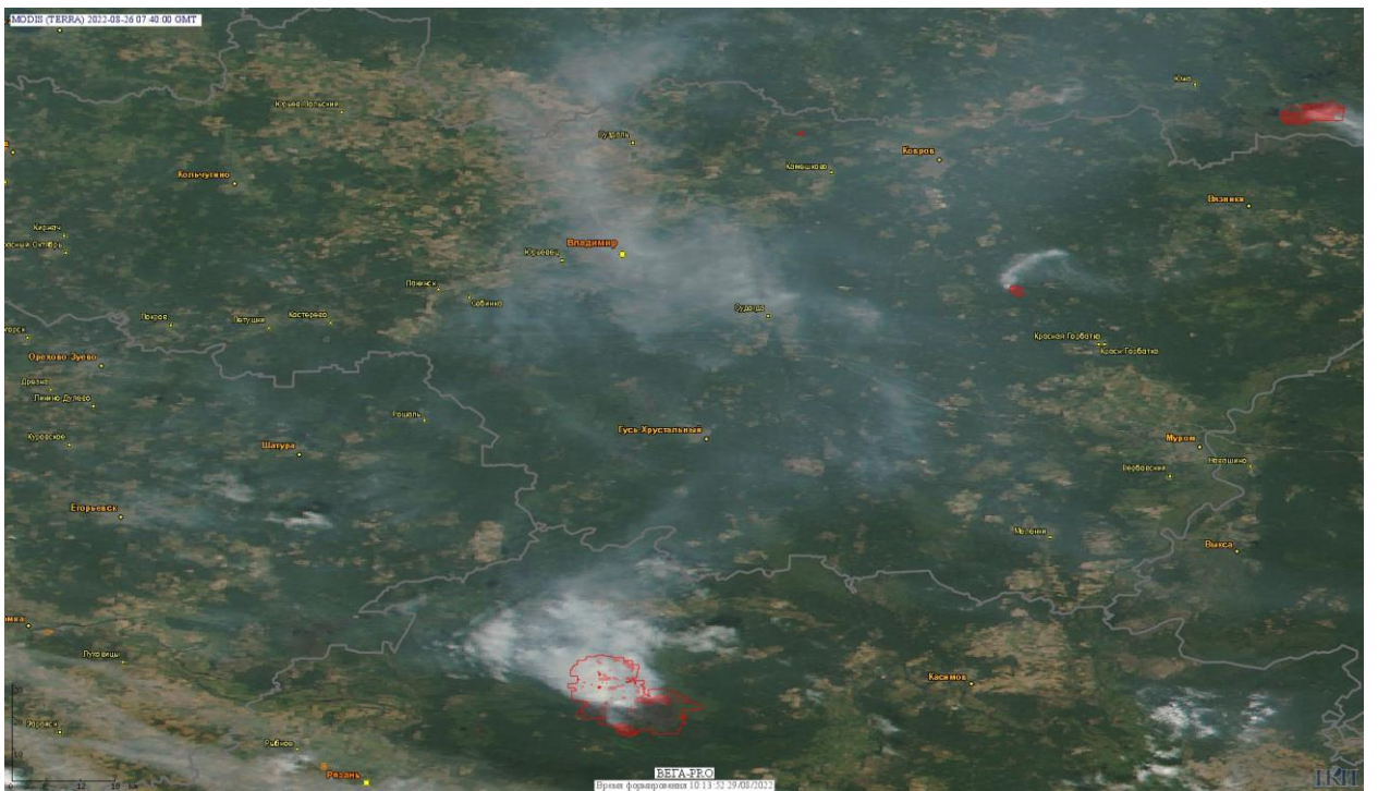
Рис. 3 Крупный пожар в Рязанской области