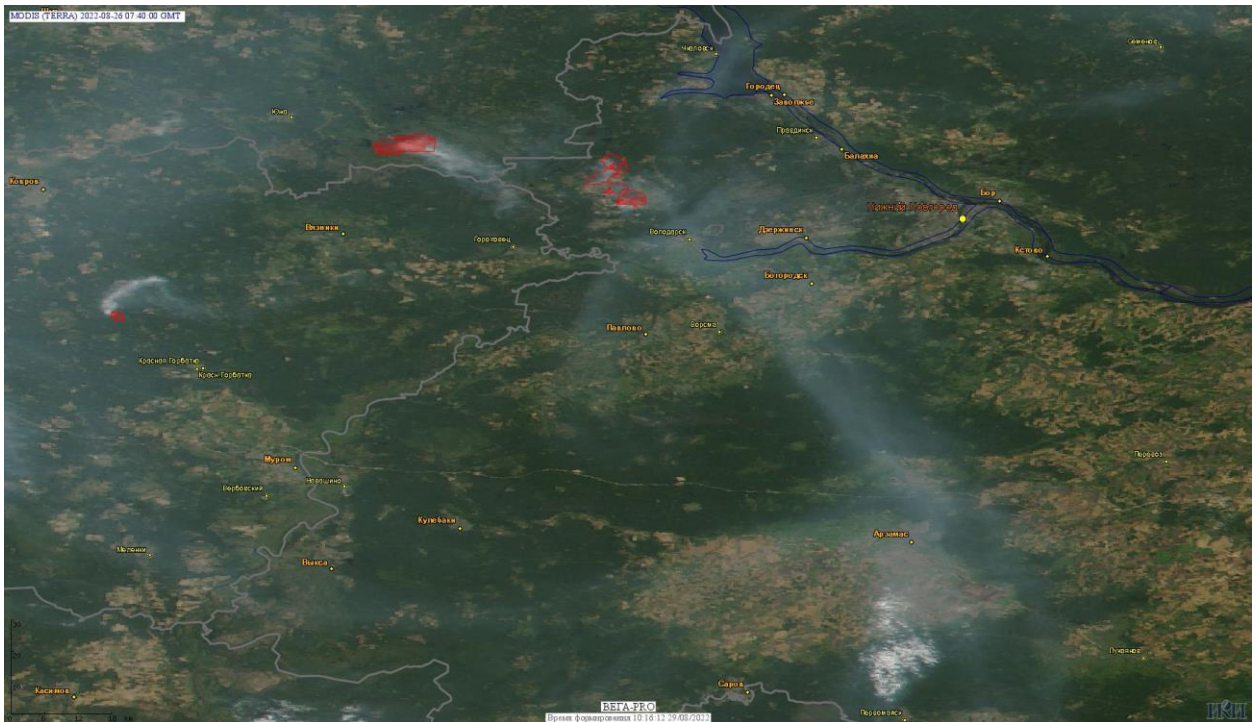
Рис. 4 Пожары в Нижегородской, Владимирской и Ивановской областях

(Информация подготовлена на основе данных центров приема НИЦ "Планета" ( http://planet.iitp.ru/index1.html ), спутникового сервиса ВЕГА ( http://pro-vega.ru ) и открытых зарубежных источников)